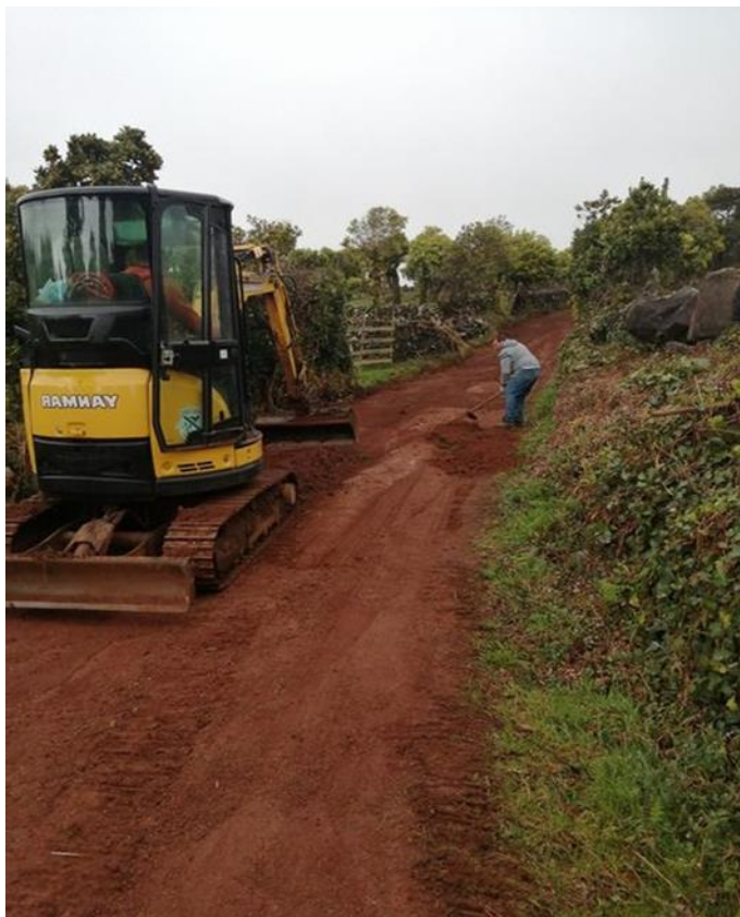
Canada do Loural