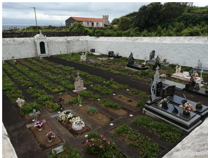
Fajã dos Vimes