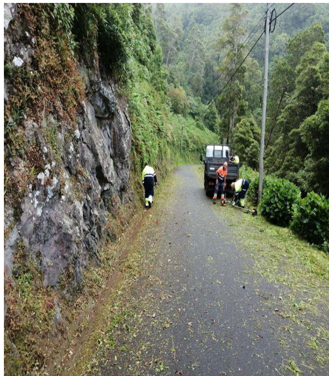
Acesso à Fajã dos Vimes

A Junta de Freguesia de Ribeira Seca tem vindo a realizar diversas manutenções em caminhos, bem como limpezas, pinturas (interiores e exteriores) da sede da Junta, colaborações com as instituições e coletividades da Freguesia, criação de página web (em atualização) freguesiaderibeirasecasaojorge.com