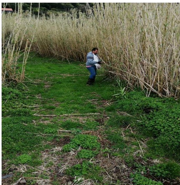
Fajã dos Cubres